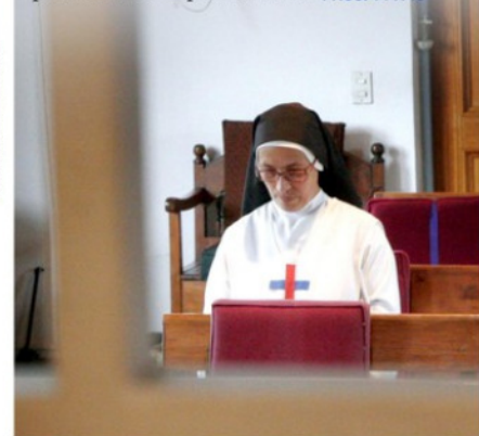
ILUSTRACIÓN: PHYLLIS TEBBS C.

Cómo cambió la agenda público-privada de la Región tras el 27/F