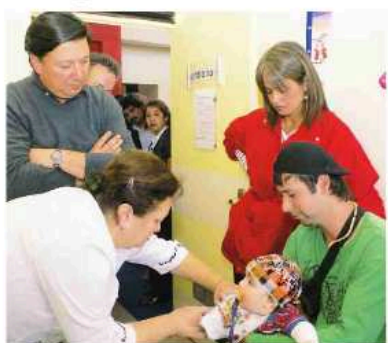
Intendenta Jacqueline van Rysselberghe encabezó lanzamiento de campaña de vacunación anti influenza humana.

Luego recaló que, dado el impacto del terremoto ocurrido el 27 de febrero, este año se ampliará la cobertura de la vacuna a todos los niños de 2 a 14 años de edad exclusivamente en las regiones de O'Higgins, Maule, Bío Bío y Araucanía, asegurando así una mayor protección no sólo a los menores, sino también a toda la población, ya que de esta manera se busca reducir la circulación del germen en el ambiente. En total se administrarán 756 mil