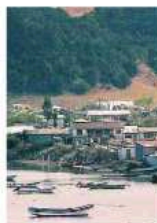
Patrimonio natural. DAÑOS DEL TERREMOTO