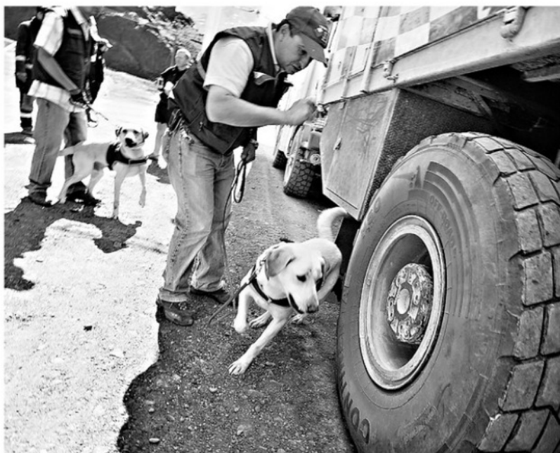
LA LABOR FISCALIZADORA del SAG y otros organismos fiscales podrá, a contar de ahora, realizarse en un sitio especializado.

Para Asmar, el proyecto está muy ligado a la construcción de su Tercer Dique.