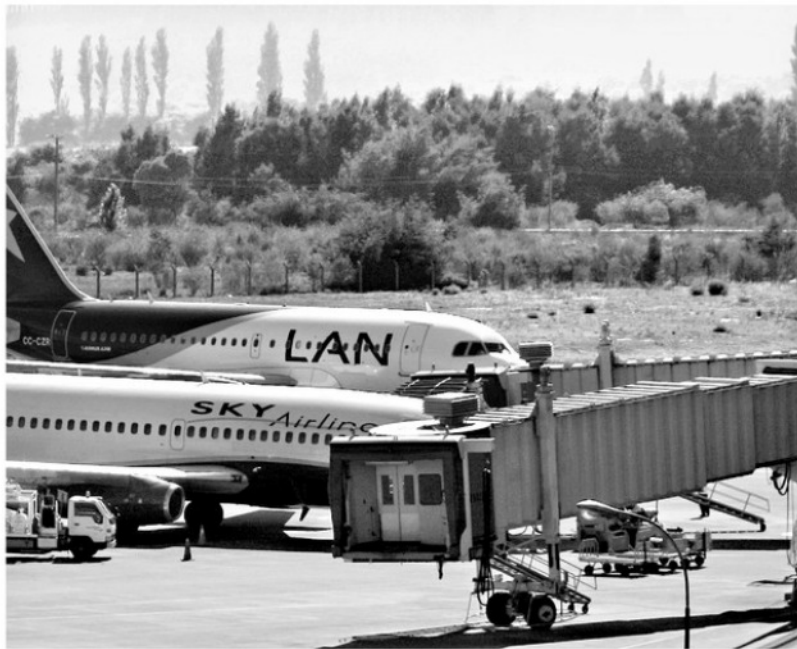
EL CONCEPTO DE Región Plataforma apunta a la integración de todos los modos de transporte de carga, incluidos los aviones.

Por tanto, y sin duda, que la planificación integrada y sistémica es la postura correcta a las iniciativas en el ámbito logístico portuario, y es en estos términos que nuestra región se ha venido desarrollando, sin embargo, aún queda mucho camino por recorrer.